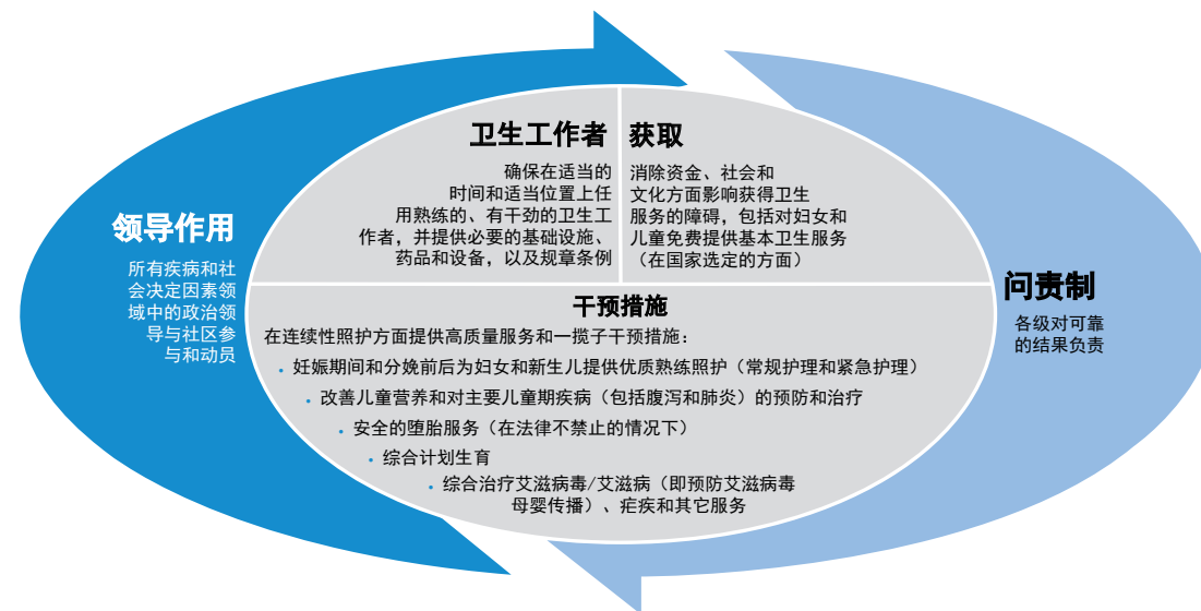
图1.孕产妇、新生儿和儿童健康全球共识

由广泛的利益攸关方制定和通过的《孕产妇、新生儿和儿童健康全球共识》（见图1），提出了加快进展的方针。它强调有必要根据一整套重点干预措施（卫生专业人员称为连续性照护）来调整政策、投资和服务提供，为利益攸关方提供了一个框架，以采取协调一致的行动。