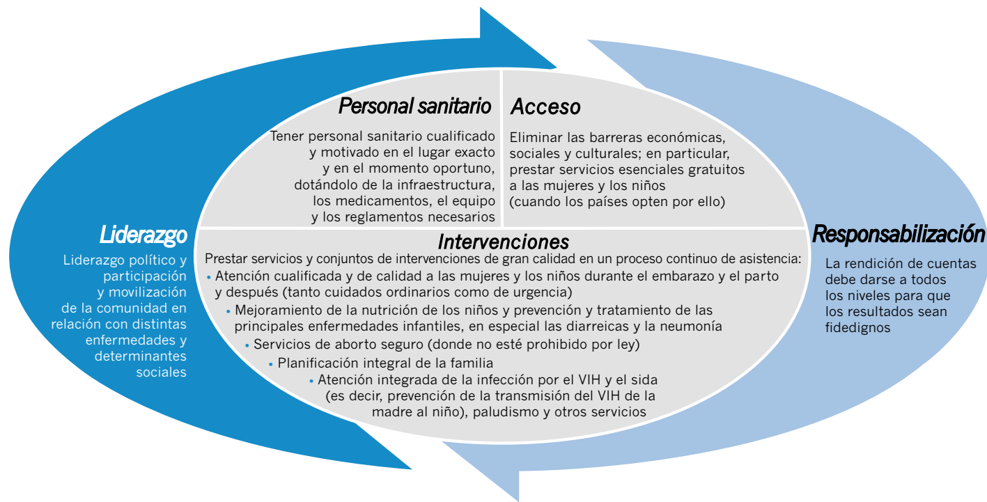
Figura 1. El Consenso Mundial para la Salud de la Madre, del Recién Nacido y del Niño